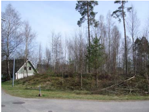
Vy från nordväst