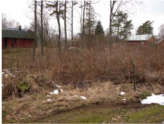
Vy från öster