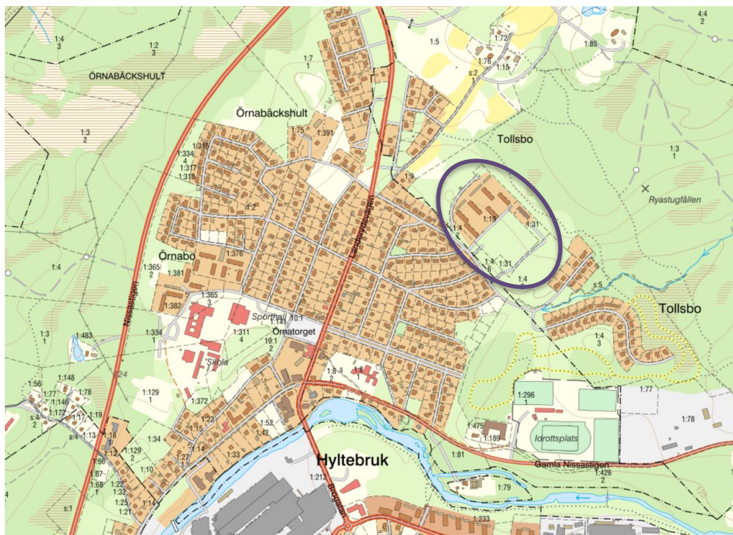
Kartan visar läget för Tollsbo 1:19 och 1:31 i Hyltebruk.