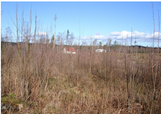
Vy från sydost

Kommunalt VA: finns utmed Bro- och Kärrvägen