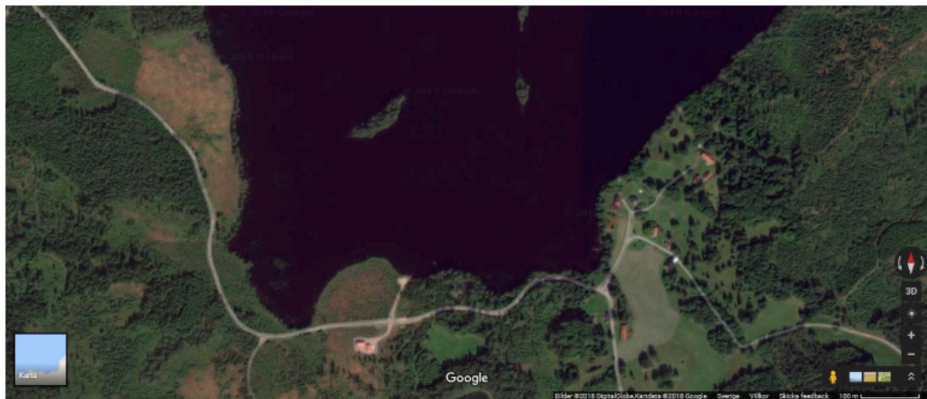
Bild på området LIS 24 från Google Maps.