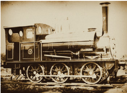
HNJ 7 - 1883

HNJ åt sydväst med linjen till Halmstad och åt nordost till Nässjö och Jönköping. Norrut kunde man på Västra Centralbanan ta sig med tåg ända till Falköping. Denna järnväg, Västra Centralbanans Järnväg, VCJ, var administrativt uppdelad. VCJ ägde järnvägen medans HNJ svarade för trafiken även på den sträckan. Efter tillkomsten av VCJ 1906 blev Landeryd en järnvägsknutpunkt med allt vad det innebar. Rangering av godsvagnar, lastning av gods, byte för resenärer och inte minst, Landeryd fick sin egna lokstation. Där kunde loken ta vatten och kol, slaggas och genomgå mindre översyner. Större översyner gjordes alltid vid lokstationen i Halmstad. Som mest fanns under järnvägens blomstringstid 250 personer i Landeryd som direkt hade sin sysselsättning vid järnvägen.