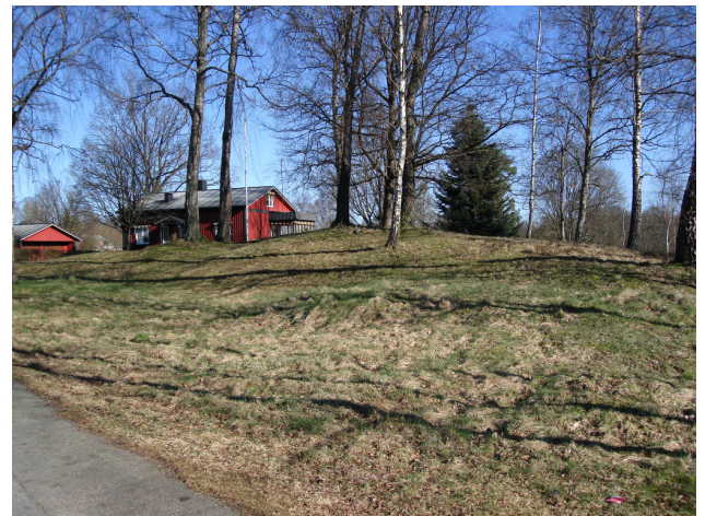
Vy från sydväst