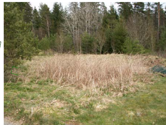
Vy från sydväst