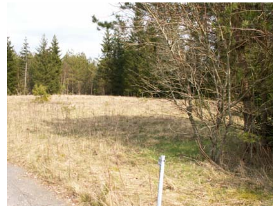
Vy från sydväst