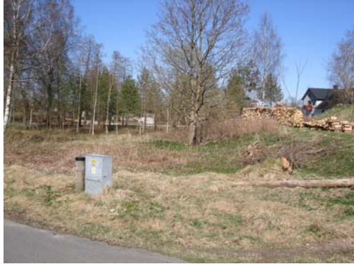
Vy från sydväst