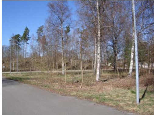
Vy från sydväst