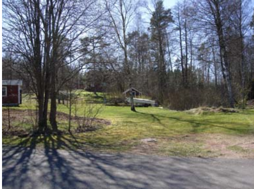
Vy från nordost