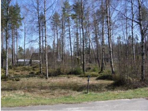
Vy från nordväst