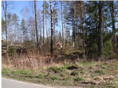
Vy från nordväst