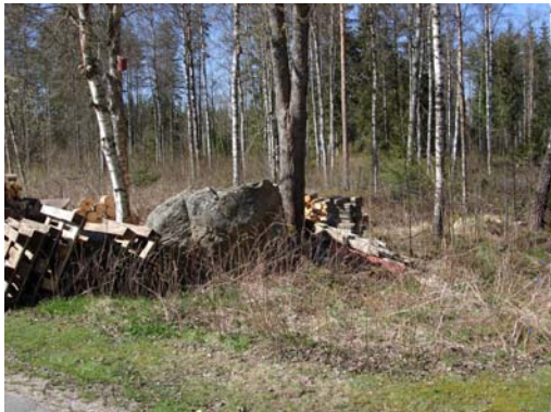
Vy från sydost