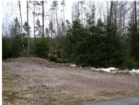
Vy från nordväst