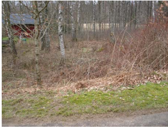
Vy från öster