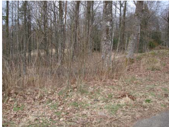
Vy från sydost