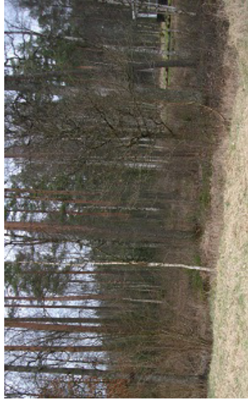
Vy från söder