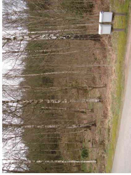
Vy från öster