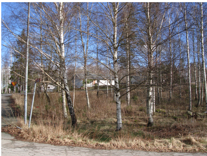
Vy från sydväst