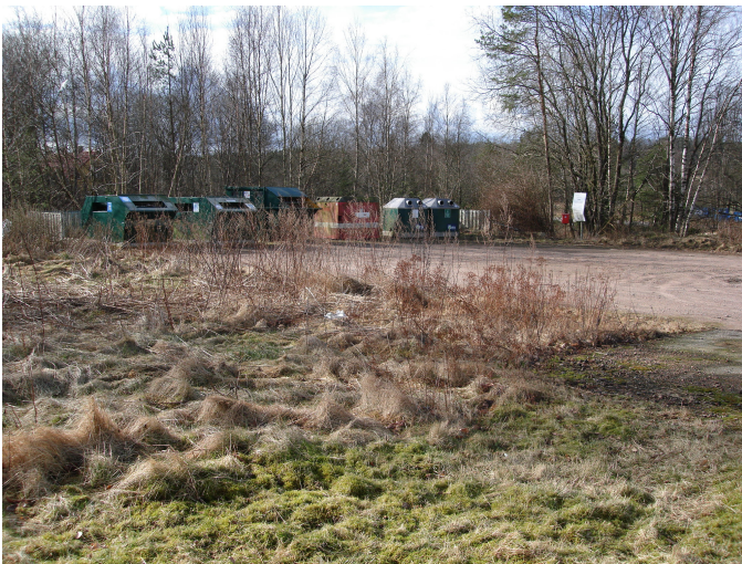
Vy från nordväst