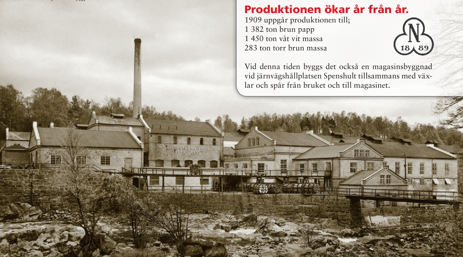
Bruket efter ombyggnation 1928-30

Vid denna tiden byggs det också en magasinsbyggnad vid järnväghållplatsen Spenshult tillsammans med växlar och spår från bruket och till magasinet.