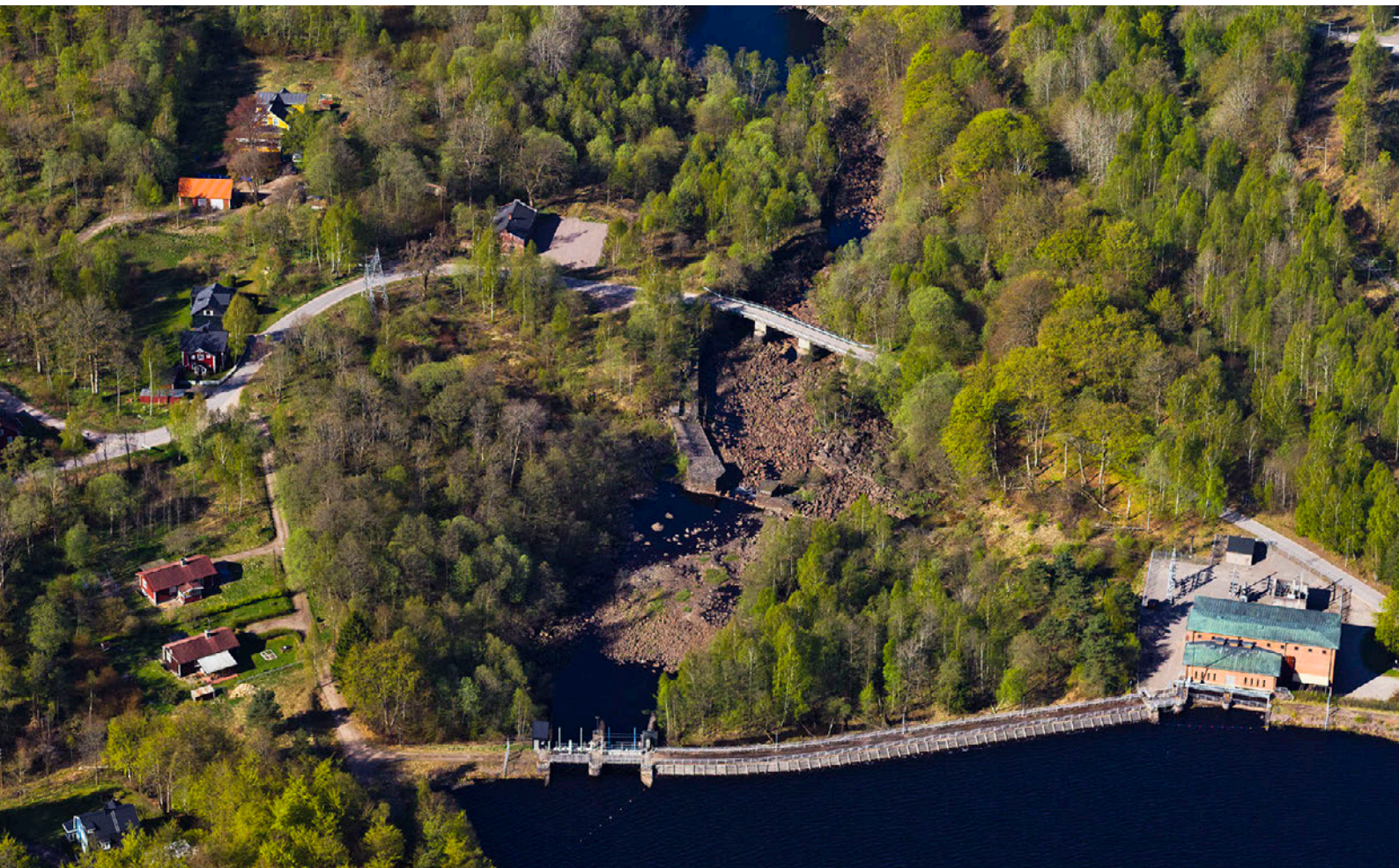
Flygfoto 2011 över Nissaström.

Produktionen av pappersmassa upphörde 1967, men återupptogs 1969 då ett norskt företag arrenderade maskinerna. Detta norska företag fortsatte med produktionen fram till den 29 december 1978. Personalstyrkan de sista åren var bara 5-7 man, vilket kan jämföras med 1930-talet då bruket hade drygt ett hundratal anställda.