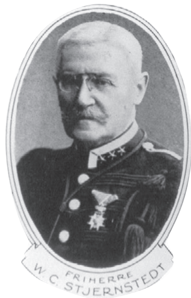
Nissaströms Bruk 1910

I december 1888 fick fallen i Grumshult besök av friherre W.C. Stjernstedt från Lökene i Värmland, som efter en äventyrlig strapats tillsammans med en medhjälpare, tog sig över Nissan och upp för höjderna på motsatta sidan. Detta besök skulle visa sig få stor betydelse för området. Snart började rykten gå på bygden att fallen samt mark om c:a 50 tunnland (c:a 250.000 m 2 ) sålts till friherre Stjernstedt. Detta visade sig vara sant då det den 18 januari 1889 utfärdades en inbjudan om teckning av aktier i Nissaströms Aktiebolag. Friherre Stjernstedt förband sig att sälja sin del av vattenfallet och marken för 3 000 kr mot att han skulle vara bolagets "affairsdisponent" under 5 år. Aktiekapitalet var då 83 000 kr.