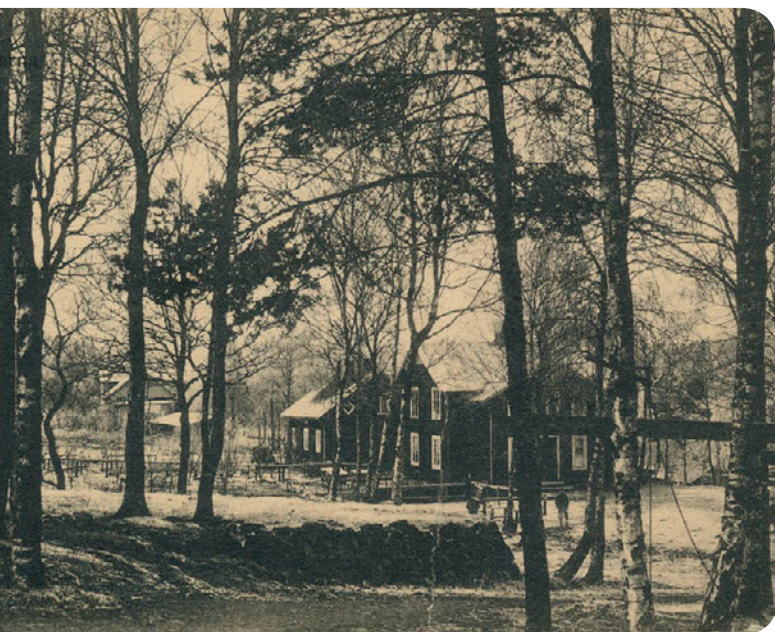
Arbetarbostäder i Nissaström

1917 köper Edwin Berger majoriteten av aktierna i bolaget och blir ordförande i styrelsen. Samtliga aktier köps av direktör Berger 1926. Moderniseringar och utbyggnader tog verklig fart samma år. Ytterligare en kokare och ett antal nya maskiner för papp-tillverkning införskaffas. 1928 görs en ny moderniseringsplan, där 2 nya turbinaggregat av senaste konstruktion om 500 hk vardera skulle införskaffas och ersätta de 2 tidigare om 240 hk. Efter att detta skett hade man alltså mer än fördubblat effekten med samma vattenmängd. 1930, efter ytterligare investeringar och tillbyggnader omfattande c:a 2000 kvm, har kapaciteten nu ökat till 7 500 ton torr vikt varav c:a 4 - 5 000 ton går till papperstillverkning och resten trämassa.